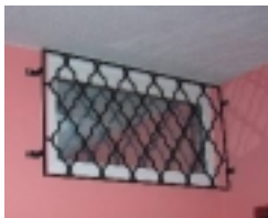
Vzor 2010 - M02