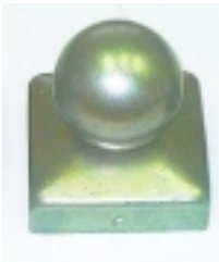
StÅ™Å-Åjka s koulÅ- 103,00 KÅ•