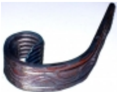
Madlo-ukonÄ•enÄ- 91,00 KÄ•

kovanÄ© na hranÄjch s drÄjÄ¼kami, rozmÄr 190x110 [Popis zboÄ¼Ä-...]