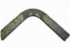
Madlo-polotovar zÄ¡bradiÄ- 111,00 KÄ•

vzor kÄ´ra, rozmÄ›r 250 250 [ Popis zboÄ¾Ä-... ]