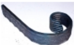
Madlo.ukonÄ•enÄ- 97,00 KÄ•

vzor vinnÄ½ list, rozmÄr 250x250 [Popis zboÄ¼Ä-...]