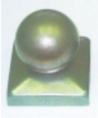
StÅ™Å-Åjka s koulÅ- 121,00 KÅ•