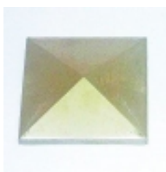
Krytka j \bar{A} sklu 49,00 K \bar{A} •

Dopl \hat{A} ky k metr \bar{A} \frac{3}{4} i