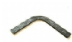
Madlo polotovar z \bar{A} jbradi \bar{A} - 103,00 K \bar{A} •

na j \bar{A} skl 60x60 [ Popis zbo \bar{A} \frac{3}{4} \bar{A} -... ]