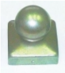
StÅ™Å¡ka s koulÅ- 103,00 KÅ•