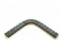
Madlo.polotovar zÄjbradlÄ- 111,00 KÄ•

vzor vlnovka, rozmÄr 190x110 [Popis zboÄ¼Ä-...]