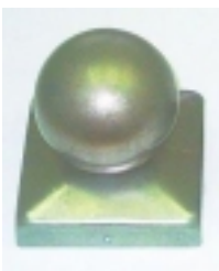
StÄ™Äjka s koulÄ- 121,00 KÄ•

vzor vinnÄ½ list, rozmÄr 190x110 [Popis zboÄ¼Ä-...]