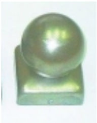
StÅ™Å¡ka s koulÅ- 85,00 KÅ•